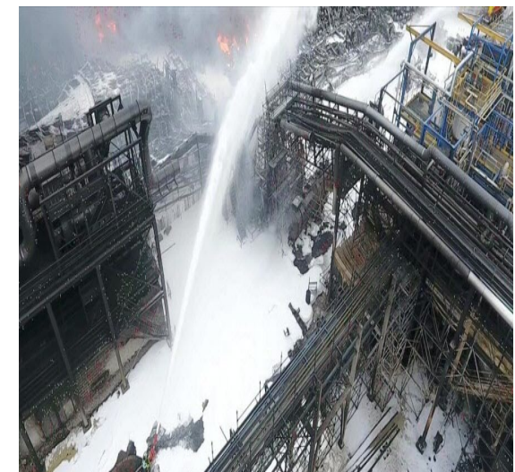
Lubrizol Rouen 2019