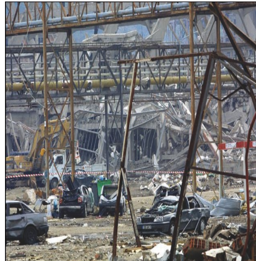
AZF Toulouse 2001