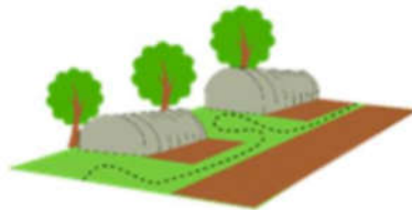
Espaces tests agricole