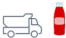
Outils collectifs de