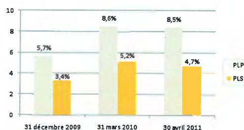
Évolution de la vacance locative dans la zone frontalière (Pontarlier-Mâche-Morteau)

La vacance est essentiellement centralisée sur les communes rurales se situant loin des bourgs et des villes. Dans ces secteurs, le parc non occupé concerne tous les types de logements (appartements et maisons). La demande est impor-