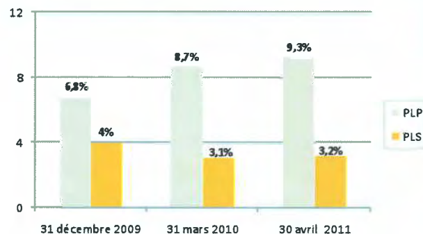
Évolution de la vacance locative à Besançon

Dans le parc locatif social, la vacance à Besançon reste limitée et maîtrisée :