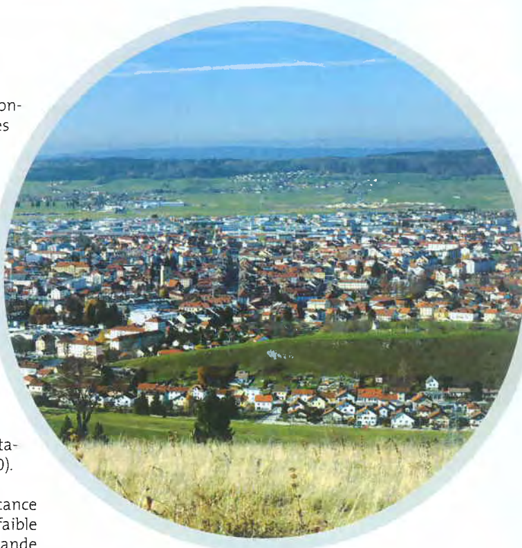
6 Zone frontalière parc privé : 520 logements enquêtés dont 45 vacants

Tous les types de logements sont concernés par la vacance dans ce secteur. Cependant, le taux de vacance est plus faible que dans le reste du département. Le niveau de la demande est toujours soutenu, même si l'attractivité du marché apparaît en diminution sur le secteur de Maïche et de Morteau.