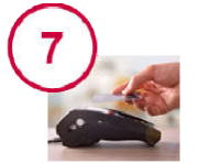
Gestion des paiements